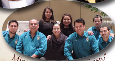
Ministerio "Fuerza de Cristo"