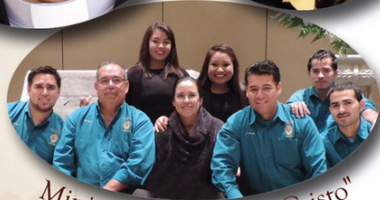
Ministerio "Fuerza de Cristo"